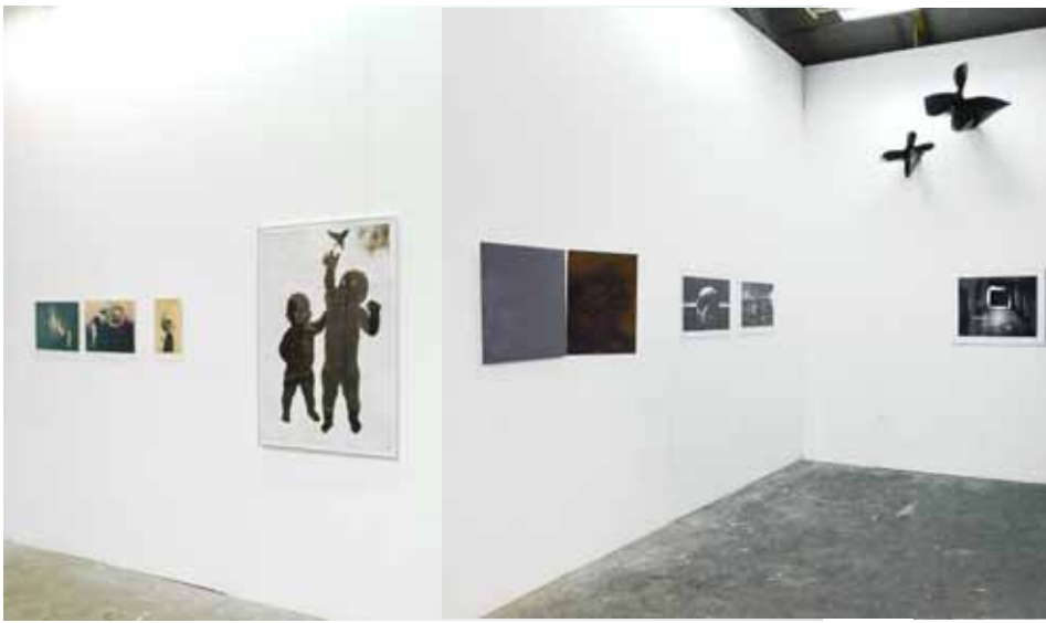
Das allerneueste Testament | Kerstin Stephan