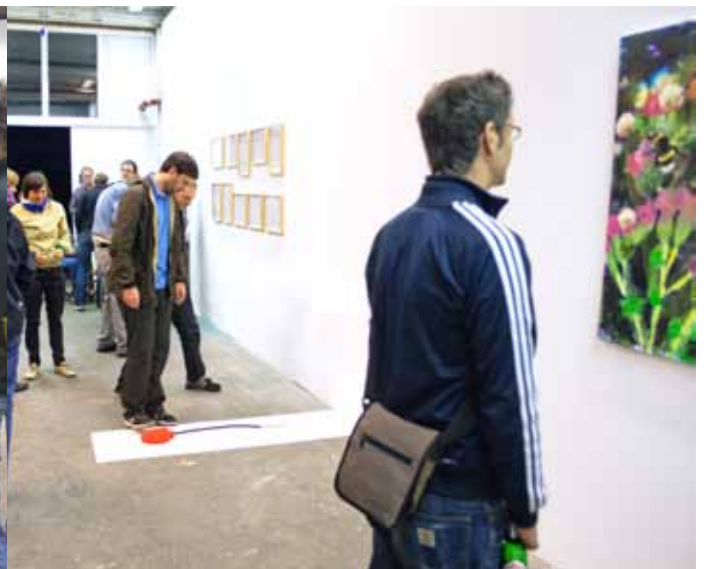
Nachts sind alle Katzen grau | Philippa Jasper