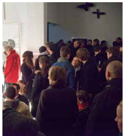
Konzert | the Pinkis