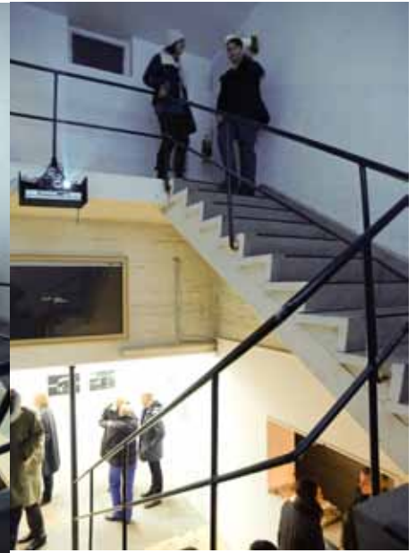
Bar und Empore