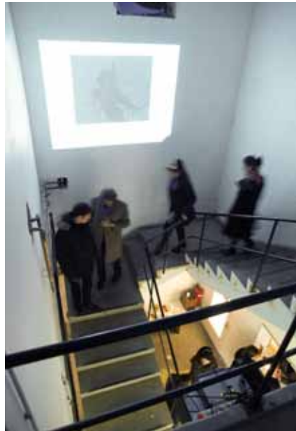
Tafelbild | Karin Kopka-Musch