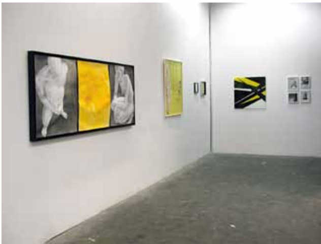
Isabell Kamp | Adam + Eve (all fucked up) 2010