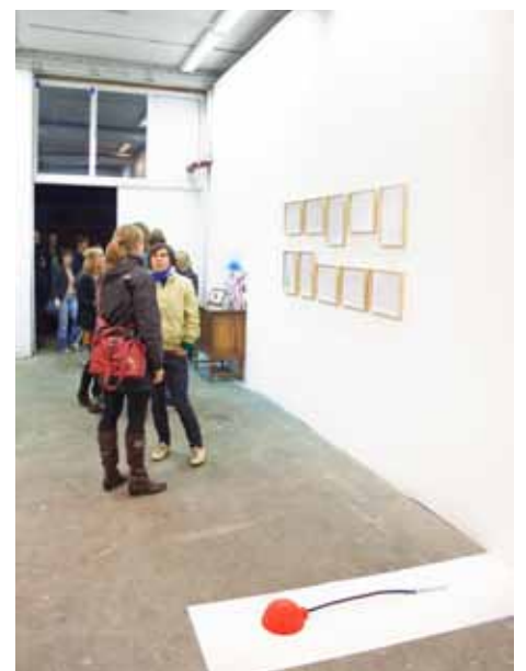
Trio für Rot, Blau und Magenta | Karen Winzer