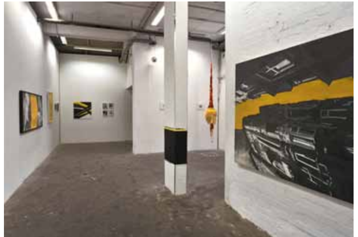
Marc Wittkowski | passing planet yellow 2010