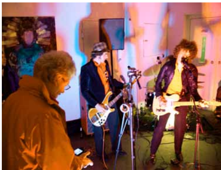
Konzert | The Gallantiers