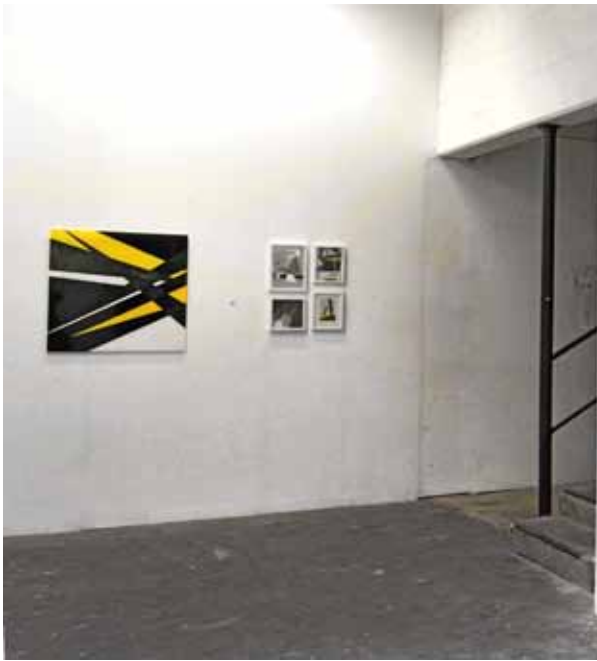
Sandra Poppe | gelbe Pyramide 2010