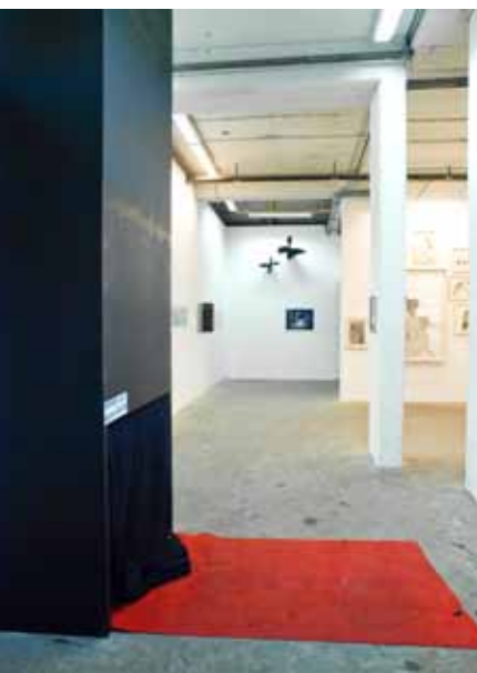
Prometheus Talentschmiede | Lukasz Chrobok