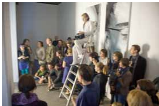
Besucher und Party